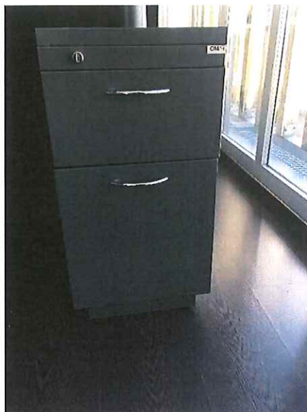
MODELO FOTOGRAFÍA DE ARMARIO BAJO DE 90 X 75.